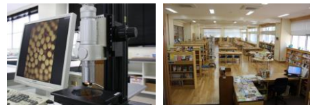
デジタルマイクロスコープ