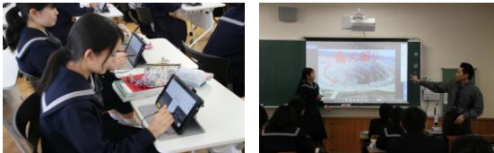
タブレット・電子黒板を使った授業