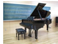
スタインウェイピアノ