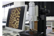
デジタルマイクロスコープ