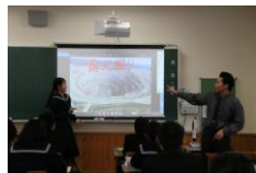
タブレット・電子黒板を使った授業